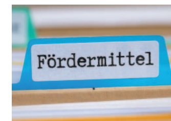
Fördermittel rechtzeitig beantragen