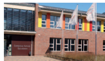
Gute Schulen sind die Voraussetzung für gute Schüler