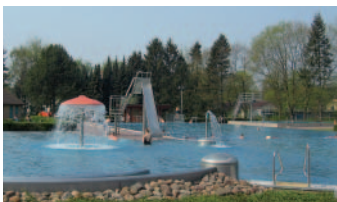
Das Freibad erhalten und dort auch für Schwimmunterricht sorgen