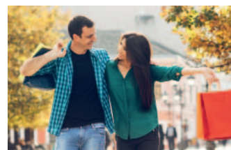
Ideen für ein attraktives Stadtbild müssen vorangetrieben werden

Quickborn wächst und gedeiht – und damit steigen auch die Anforderungen. Deshalb ist umsichtige und verantwortungsvolle Planung so wichtig.