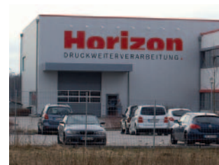
Weiteres Gewerbe gewinnen und dadurch mehr Gewerbesteuern einnehmen

Knappe Finanzmittel zwingen mehr denn je zu umsichtigem Handeln. Wichtige Investitionen in Schulen, KiTas und Infrastruktur haben zu einem hohen Schuldeniveau geführt.