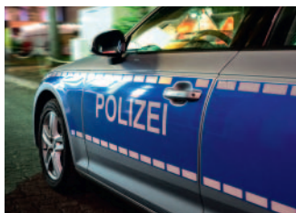
Die Polizei muss präsent sein, um Straftaten vorzubeugen